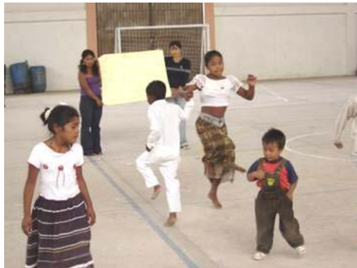
BAILE DE LA FIESTA DE NAVIDAD

Con el fin de fomentar la corresponsabilidad (no siempre recibir sino también dar) los padres y las madres realizaron la fiesta de Navidad con bailes típicos de la región y trajeron pequeñas muestras de su alimento para compartir los unos con los otros. La fiesta este año también fue un éxito.