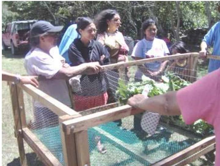
MADRES EN EL PROYECTO PRODUCTIVO

permiten utilizar y vender los productos ahí cultivados o del proyecto de cría de cuyes, que como es costumbre en la zona rural del Departamento de Nariño, este roedor es utilizado para el consumo en el hogar o para la venta. Estos proyectos se extenderán a más familias en el 2007