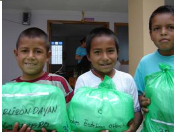
ESTUDIANTES CON LOS INSUMOS DONADOS POR LOS PADRINOS Y MADRINAS (esta vez zapatos, uniforme escolar, ropa interior y productos de aseo personal)