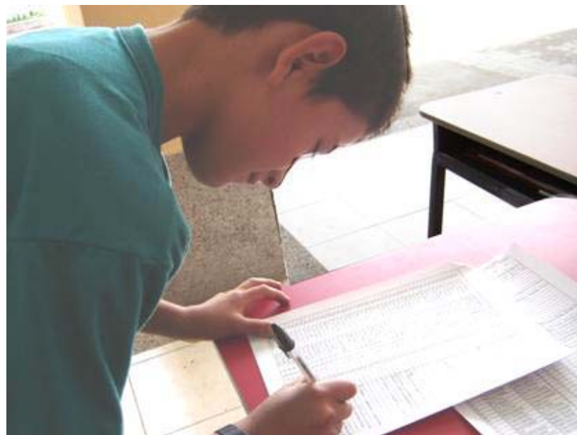
FIRMANDO LA HOJA DE QUE HA RECIBIDO LOS INSUMOS DONADOS POR LOS PADRINOS Y MADRINAS