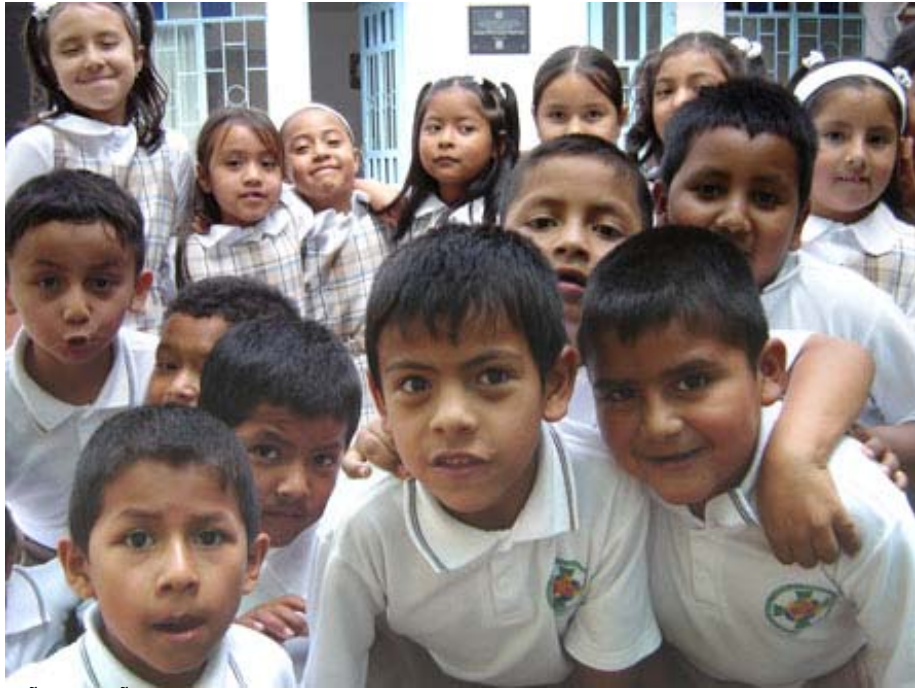
NIÑOS Y NIÑAS ESTUDIANTES DE LA FUNDACION SOL Y LUNA COLOMBIA

** un diccionario para la primaria y otro para la secundaria