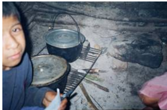
VISITA A UNA DE LAS FAMILIAS DE LA FUNDACION SOL Y LUNA COLOMBIA

3. Comenzamos la realización de un proyecto productivo para las mamás o papas de los niños y niñas de la fundación en el 2006. 40 familias se beneficiaron el año pasado con la realización de huertas caseras que les